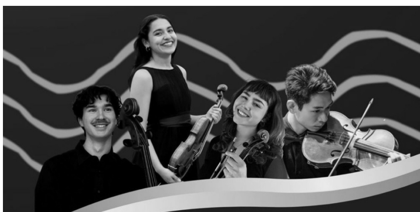
Illustration : Mario Moruzzi